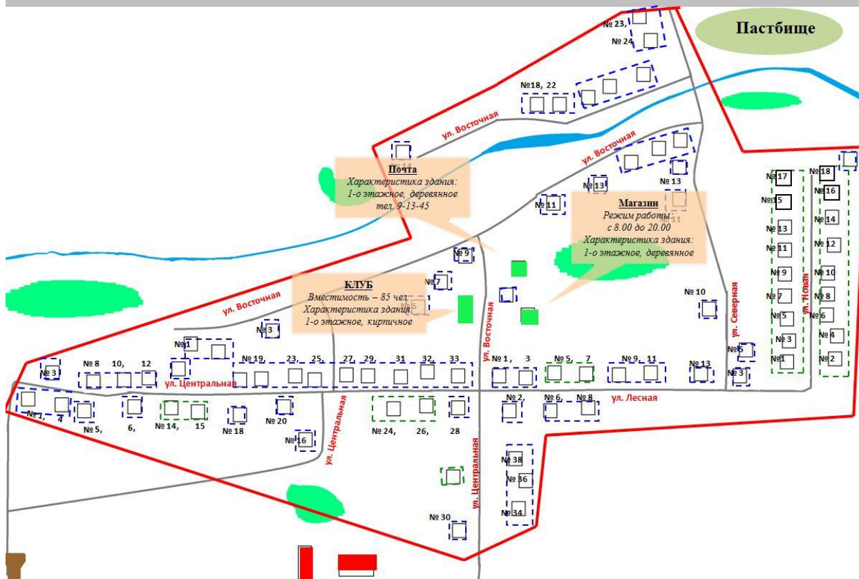
Схема деревни Ильбово Гарцевского сельского поселения Стародубского муниципального района