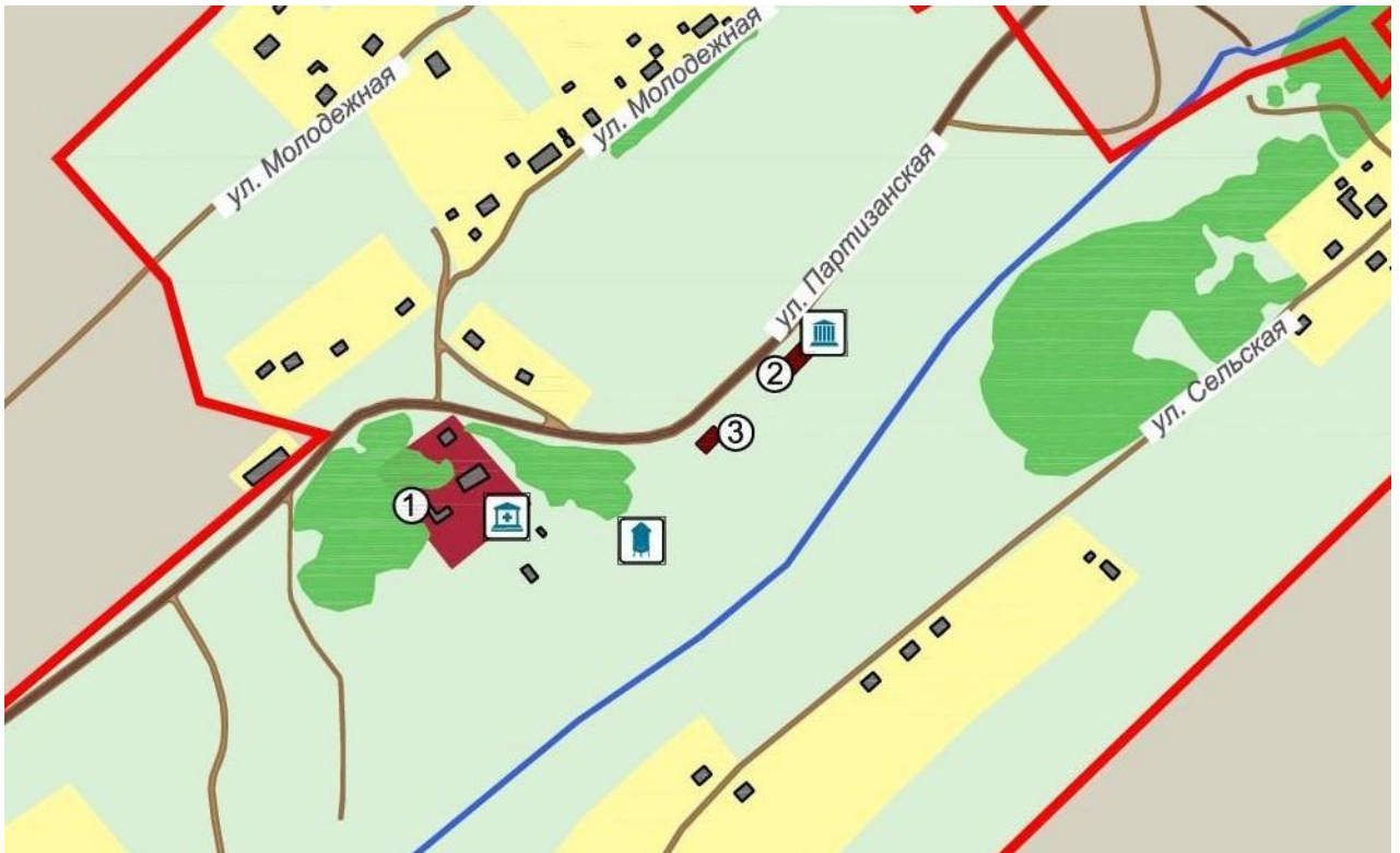
№ 1 – Сосново-Болотский ФАП

Приложение № 2 к постановлению Хмелевской сельской администрации от « 23 » апреля 2013г. № 37 и к постановлению администрации Выгоничского района № 390 от « 18 » апреля 2013 года.